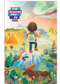
Pour les enfants d'âge scolaire