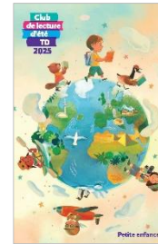
Pour la petite enfance